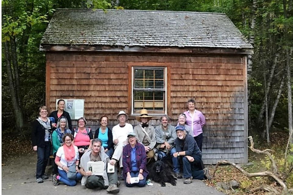
La réplique de la cabane de Thoreau lors de notre marche « Sur les traces de Thoreau » en 2016